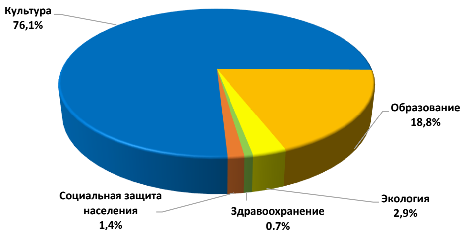
Рисунок 2 – Удельный вес услуг, которые оказывались СОНКО в 2017 году, в разрезе видов деятельности

Анализ выполнения плановых показателей объемов услуг СОНКО в 2017 году (рисунок 3) выявил следующее: