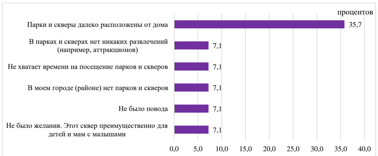
Рисунок 4 – Распределение ответов на вопрос: «Если Вы не посещали парки и скверы, то по какой причине?»

Большинство из тех, кто не посещал парки и скверы в течение лета, сослалось на то, что они далеко расположены от дома (35,7 процента). Для 7,1 процента опрошенных существенным препятствием для посещения парков и скверов является отсутствие в них развлечений (рисунок 4). Еще столько же отметили, что у них не было повода или желания посетить парк (сквер), не хватало времени на это или в их городе (районе) нет парков и скверов.