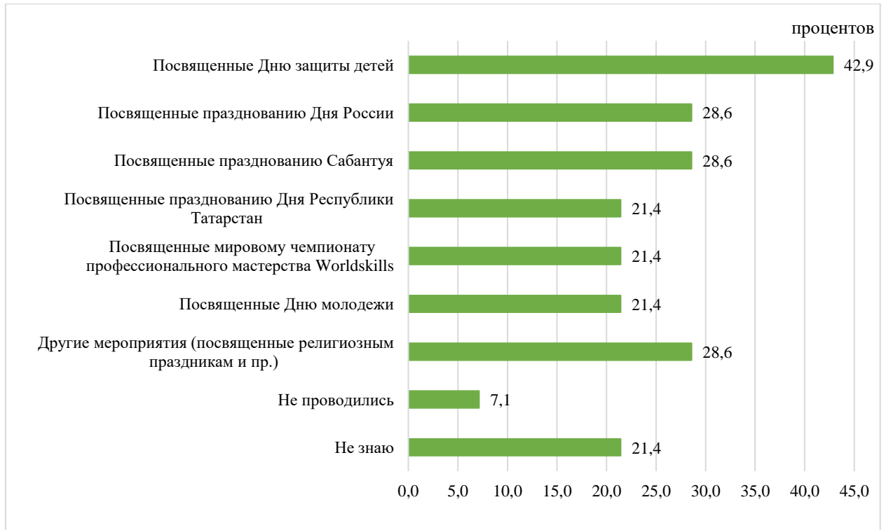
Рисунок 3 – Распределение ответов респондентов на вопрос: «Какие мероприятия проводились в парках и скверах за последние три месяца?»

Большинство из тех, кто не посещал парки и скверы в течение лета, сослалось на то, что они далеко расположены от дома (35,7 процента). Для 7,1 процента опрошенных существенным препятствием для посещения парков и скверов является отсутствие в них развлечений (рисунок 4). Еще столько же отметили, что у них не было повода или желания посетить парк (сквер), не хватало времени на это или в их городе (районе) нет парков и скверов.