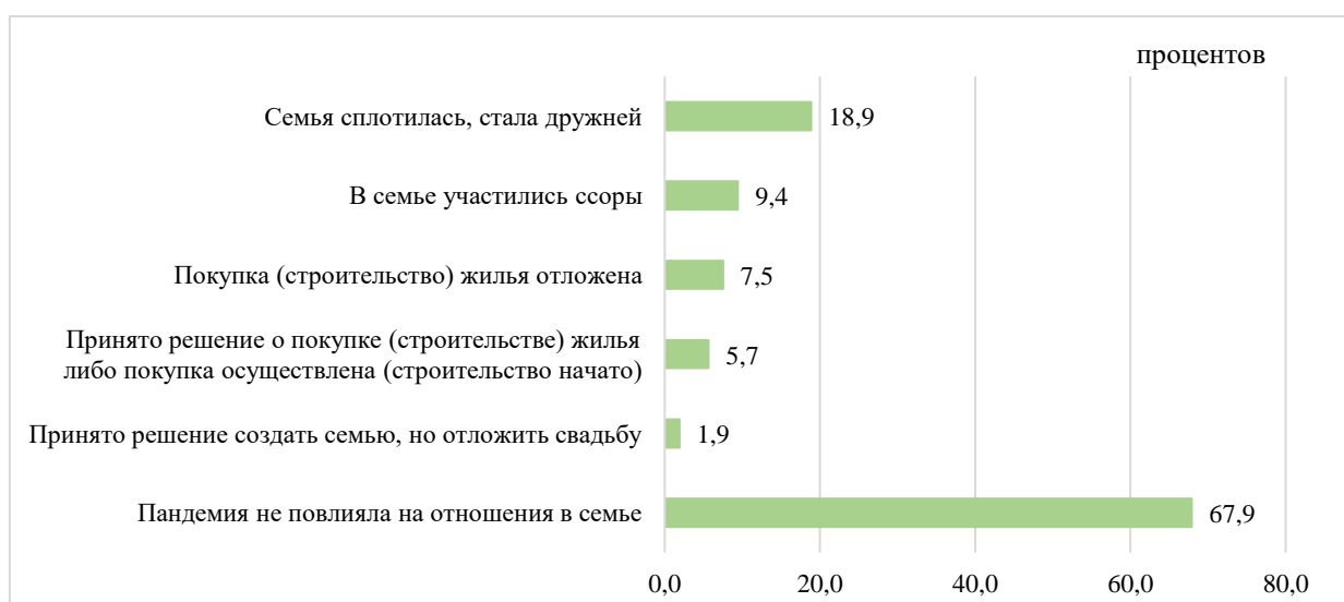
Рисунок 1 – Распределение ответов на вопрос: «Как пандемия повлияла на отношения в семье? Отметьте, пожалуйста, подходящие варианты ответов об изменениях, произошедших в Вашей жизни вследствие пандемии.»

Еще свободные 1,9 процента участников опроса решили создать семью, однако из-за пандемии вынуждены были отложить свадьбу (рисунок 1).